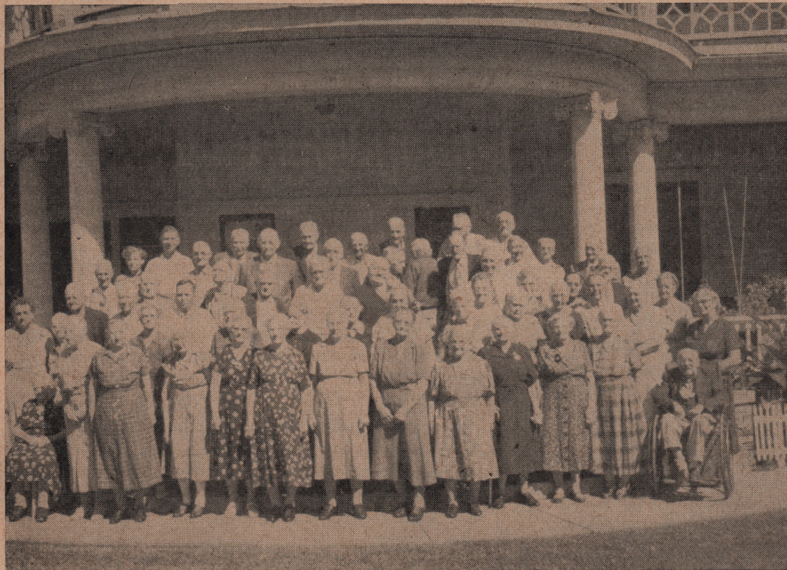
Et Gruppebillede af Familien paa Salems Hjemmet for Tiden