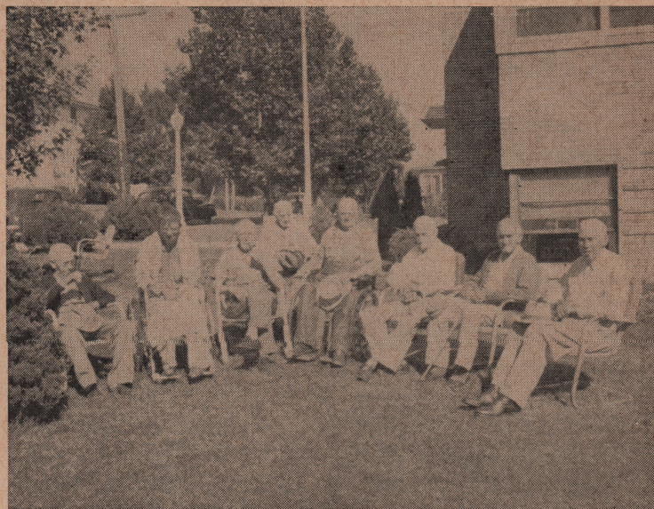
En Gruppe Invalider nyder Solskinnet paa Hjemmets Plæne