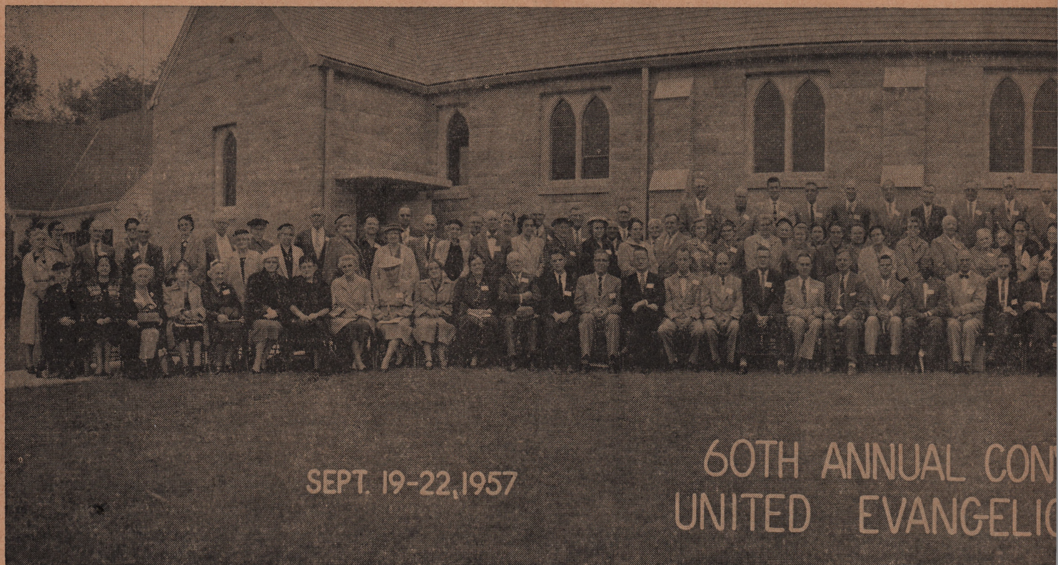
Iowa Kredsforbmsamling i Spencer ve