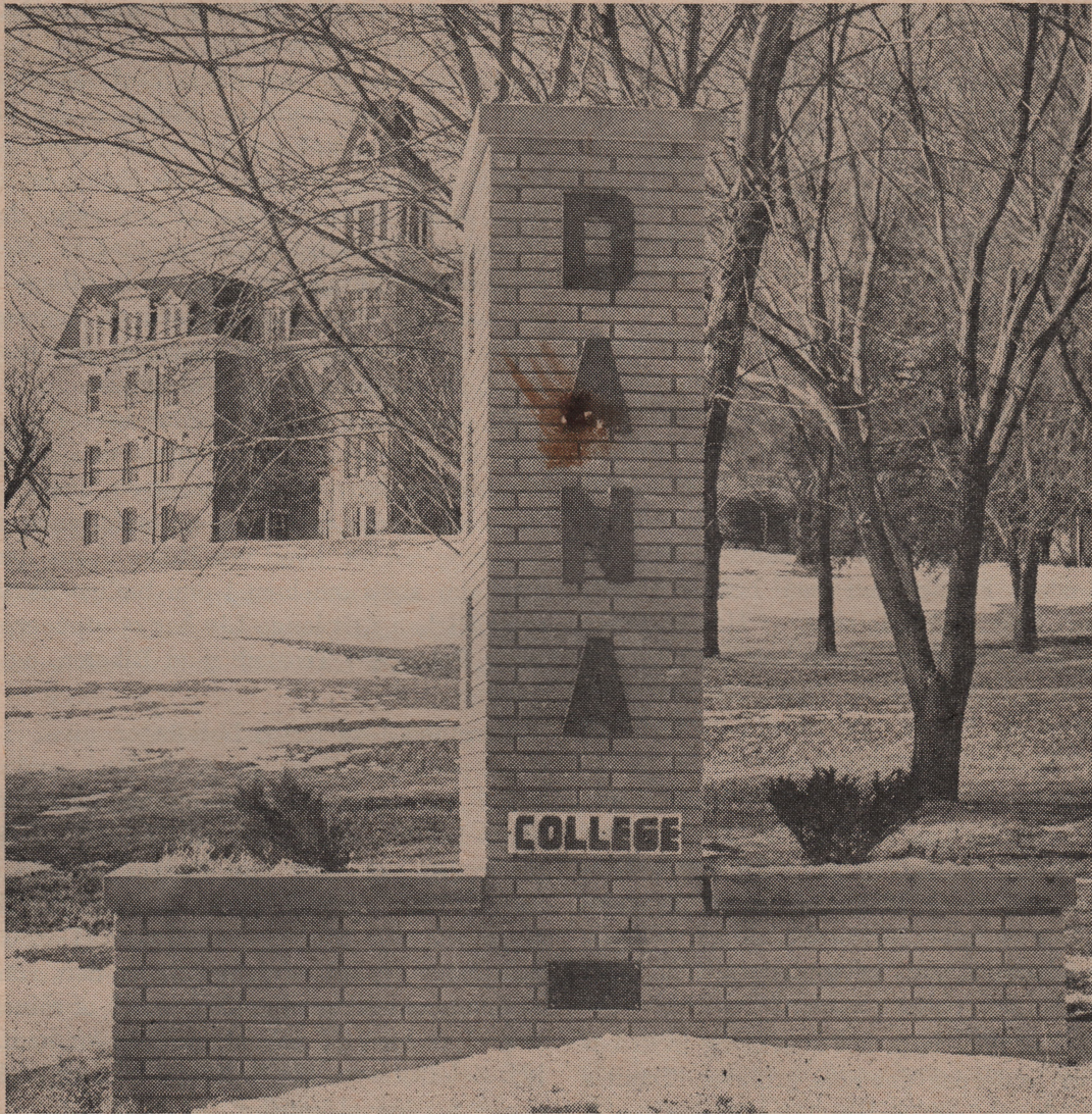
„Old Main“ Bygningen paa Bakkeafsatsen vest for Blair By

Skolens Front skuer mod Øst, et herligt Syn ud over Missouri Dalen med den nu ret udstrakte Blair By i Forgrunden og den brede vandrige Flod et Par Mil ude, som kan øjnes en Snes Mil flydende i sit bugtende Leje fra Nord og drejer derpaa i sydøstlig Retning ned mod Storbyen Omaha en Snes Mil borte. Hinsides ses Iowa Sidens bølgede Bluffs, der ofte ligger i Morgendis og om Aftenen gløder farverigt i Solnedgangens Straaler, ligesaa gør Byen Missouri Valleys Hustage. Det Syn vil vi forrige Studenter, som før 20rne, havde vore Værelser i den gamle Hovedbygningens øvre Etager, aldrig glemme. — Monumentet i Forgrunden staar i det nordøstlige Hjørne af den gamle Campus og blev rejst af en tidligere Afgangsklasse. Nu forlader atter en større Klasse af ca. 40 Elever vor Kirkeskole med gode Impulser og haabefulde Planer samt mange kære Minder, for at optage en Livsgerning. Gud velsigne dem!