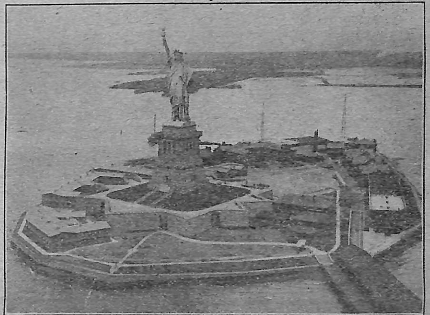
FRIHEDSSTATUEN I NEW YORK HAVN (Taget fra en Aeroplan)

Som bekendt kan Kalenderen kun faas gennem Logerne; vi haaber at de Loger, som ønsker at fordele Kalenderen blandt sine Medlemmer, vil gøre deres Bestillinger hos Hovedkontoret inden 10de November eller saa hurtigt derefter.