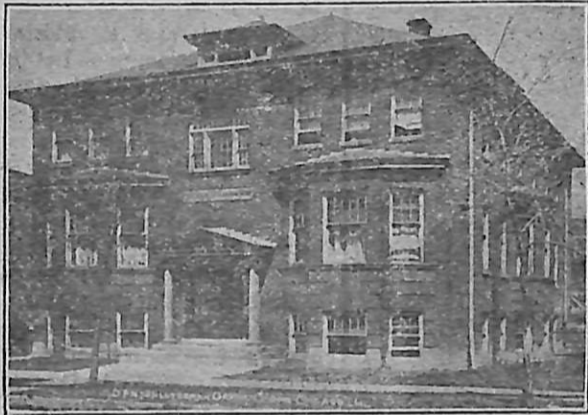
Dansk Børnehjem i Chicago.

I det man saaledes betragter hvad Aarene har bragt frem mellem Landsmænd, som forstod at løfte i Flok, saa fremgaar det tydeligt nok, at her er et Arbejde, som fortjener den videste Understøttelse. Det betaler sig for enhver dansk Mand at tilhøre en Forening som D. B. S. — ikke blot i pekuniær Henseende gennem den Hjælp som venter ham, hvis han skulde tiltrænge den — men ogsaa ved Hjælp af den Prestige og Støtte, som han opnaar ved at færdes blandt Landsmænd og nyde godt af hvad de i Samling har frembragt.