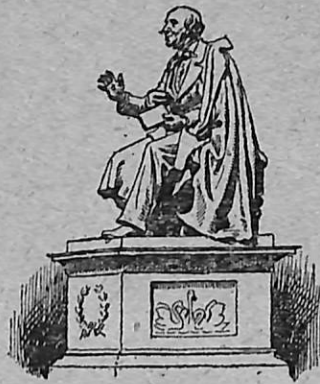
H. C. Andersens Statue.

Brodersamfundets store Betydning og Nytte bør saaledes stedse ligge vore mange Tusind Medlemmer paa Sinde, lige meget hvor de opholder sig. Det er vor kærkomne Pligt ved enhver given Lejlighed at fremhæve de Fordele, som følger med et Medlemskab i denne Forening, og vi indbyder enhver dansk Indvander til at undersøge vore Betingelser og ansøge om Optagelse. Ingen retskaffen dansk Mand vil fortryde, om han træder i Forbindelse med sine Landsmænd, og han kan som Medlem af Det Danske Brodersamfund være stolt af at være et Led i en Bevægelse, som gennem mange Aar har været og som vil vedblive at være en virkelig Velsignelse for det Folk, som kom til Amerika fra Danmark.