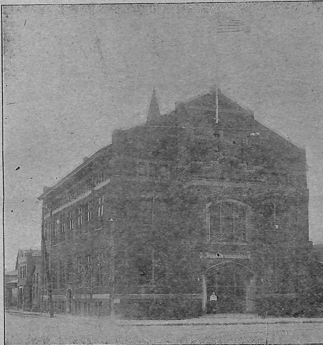
Dansk Brodersamfundts Bygning i Racine, Wis. (tilhører Loge Nr. 4).

Hvad der i Dag er af gavnlig Betydning for 22.000 Mænd og Familier af dansk Slægt har ligesaa vel Bud og Løfte til det dobbelte Antal. Det maa vedblive at være vor Pligt og Løsen at samle alle Danske i Amerika i vor Sammenslutning for derigennem yderligere at styrke vor Præstige udadtil og vor Virkelyst, Tillidsfuldhed og Evnerigdom indadtil.