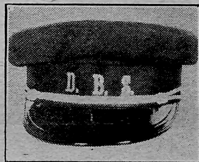
D. B. S. Danmarksturs Skibs-Kasket

samfunds Chicago Logers Central Komite, som vil sørge for deres Haandbagage og ledsage de Rejsende til Dania Hall, som vi blive Hoved-Kvarter for hele Dagen.