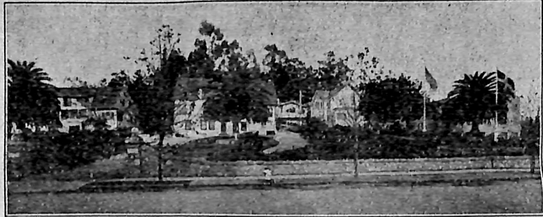
„Aldersly“, idyllisk beliggende dansk Alderdomshjem i St. Rafael, Calif.