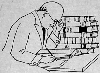
Forbudet kendtes i Oldtiden.

I hvilken Afdeling der fortælles „Om alle mulige Ting og Adskelligt til.“