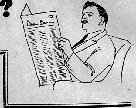
Hærvejen, Jyllands gamle Adelvej.

Der er en egen Stemmning over de gamle Veje, hvorad Slægt efter Slægt har faret i onde som gode Tider. Længseligt gemmer de Minder fra henfarne Dage, lyse og mørke i Hob. Livs brogede Tilskikkelser og Vandrings Mangfoldigheder hylder de ind i Sagnet og Poesiens Løndom. En Mystik af en egen lokkende Art ombølger de gamle Vejspor, hvor den moderne Kultur endnu ikke har gjort Mystikken og Løndommen hjemløs.