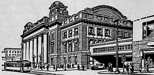
North Western Terminal Building

In planning to visit our convention in Denver the 16th to the 21st of September, the choice of route is a very important factor.