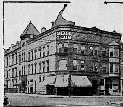
Loge Nr. 35's Bygning i Chicago.

„35“ ejer sit eget Hjem, „Odin Bygning“. Det maa have taget Mod og Foretagsomhed for en Loge, som den Gang havde omkring ved 400 Medlemmer, at købe en $30,000.00 Bygning, og naturligvis har Omstændighederne ikke gjort det lettere i de sidste Aaringer. Men der kan dog nu rapporteres, at „der er Fremgang over hele Linjen“. Her er hvad „Loge Nyt“ skriver derom: