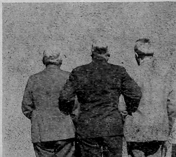
De tre „Fyre“ som skrev Historien.

Vi har Fornøjelsen at vise Billedet af dem og vi ved det ligner dem alle tre.